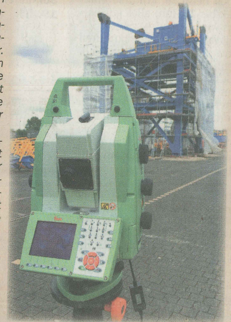
Das Foto zeigt die Vermessung des Schiffsentladers.